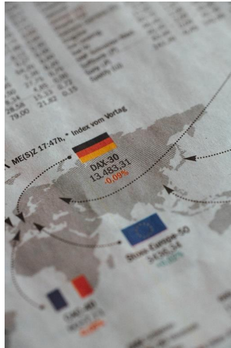
Imagen: Banderas de la UE de Alemania y Francia en el Periódico (s.f)