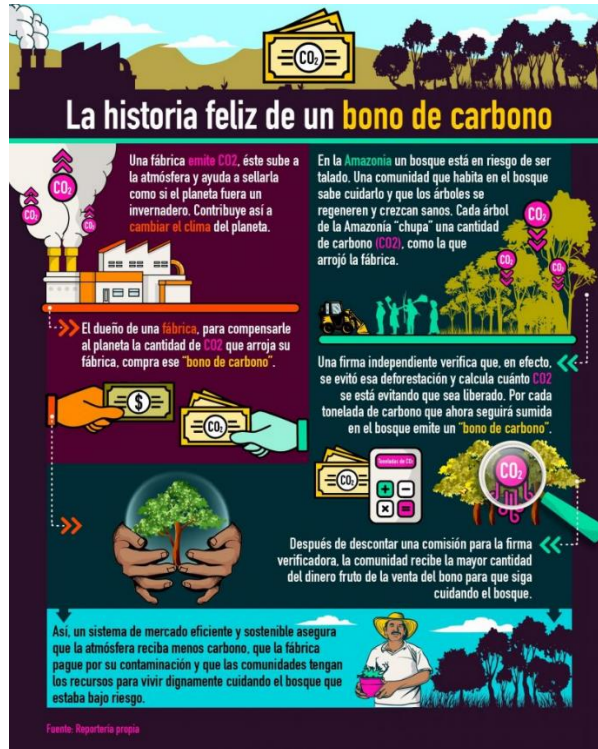
Imagen: La historia feliz de un bono de carbono (s.f) [imagen]. https://www.elclip.org/el-mayor-proyecto-de-bonos-de-carbono-de-colombia-podria-estar-vendiendo-aire-caliente/