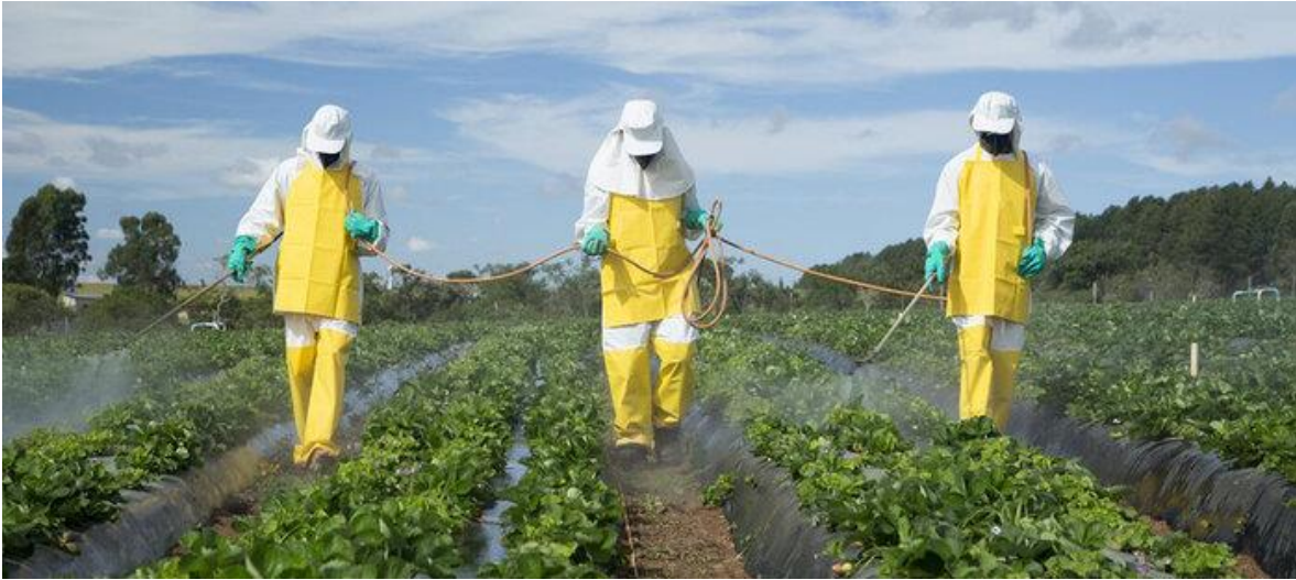
Imagen: Agroquímicos (2021) [imagen]