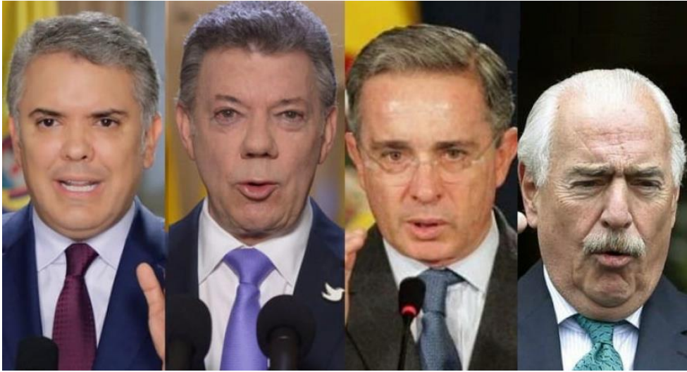
Imagen: Presidentes de Colombia de los últimos 25 años (2019) [Imagen] Pulzo. https://www.pulzo.com/economia/comparacion-cifras-desempleo-gobierno-duque-santos-uribe-pastrana-PP744577 1